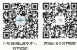
四川省国际展览中心 官方微信 成都智博会官方微信